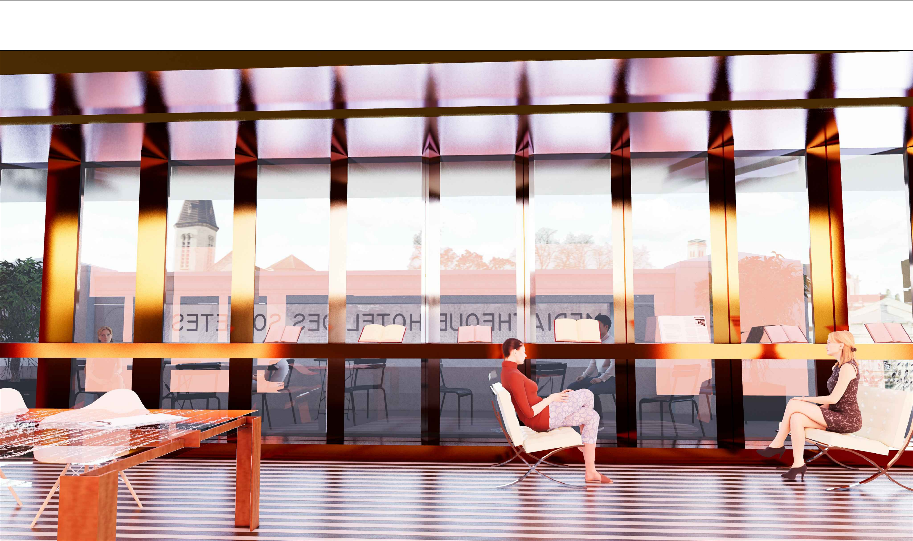
Vue vers l'extérieur depuis la lanterne