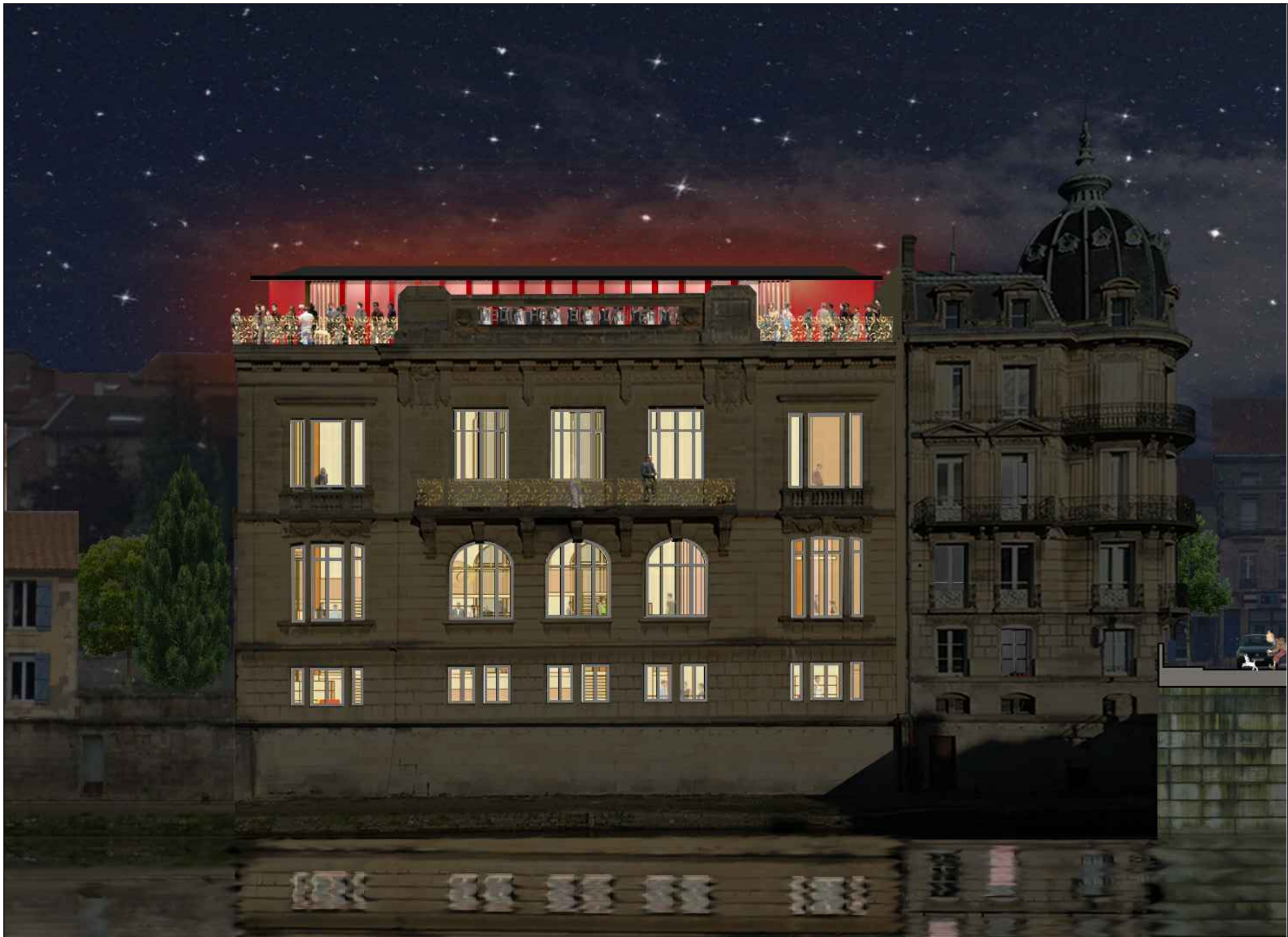
Façade sud vue de nuit