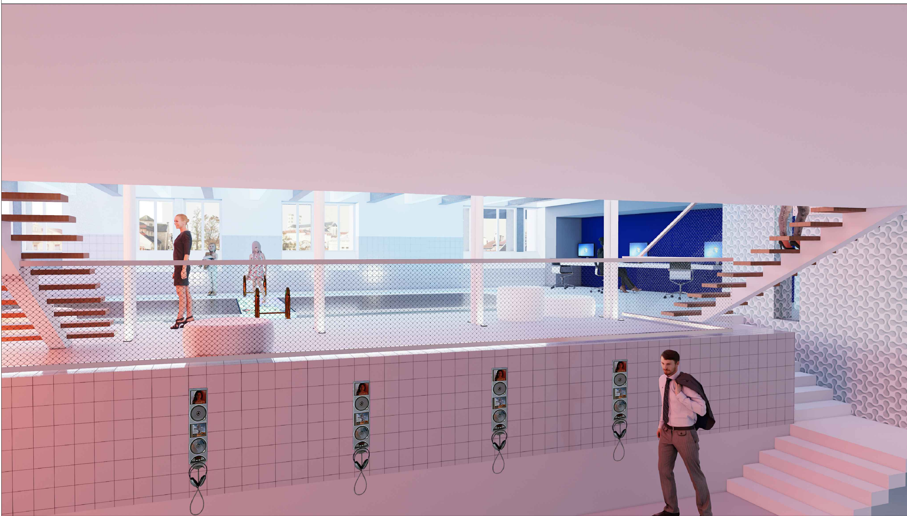
Vue depuis le dégagement 2