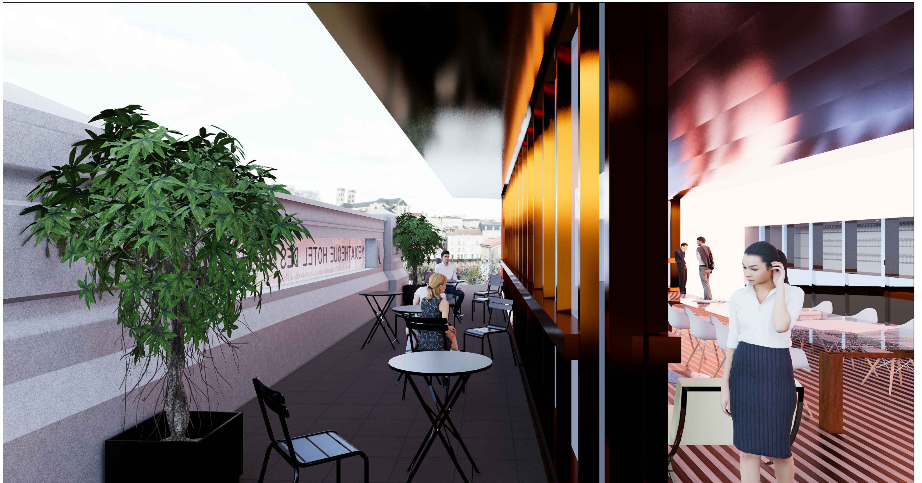
Perspective dedans/dehors de la lanterne