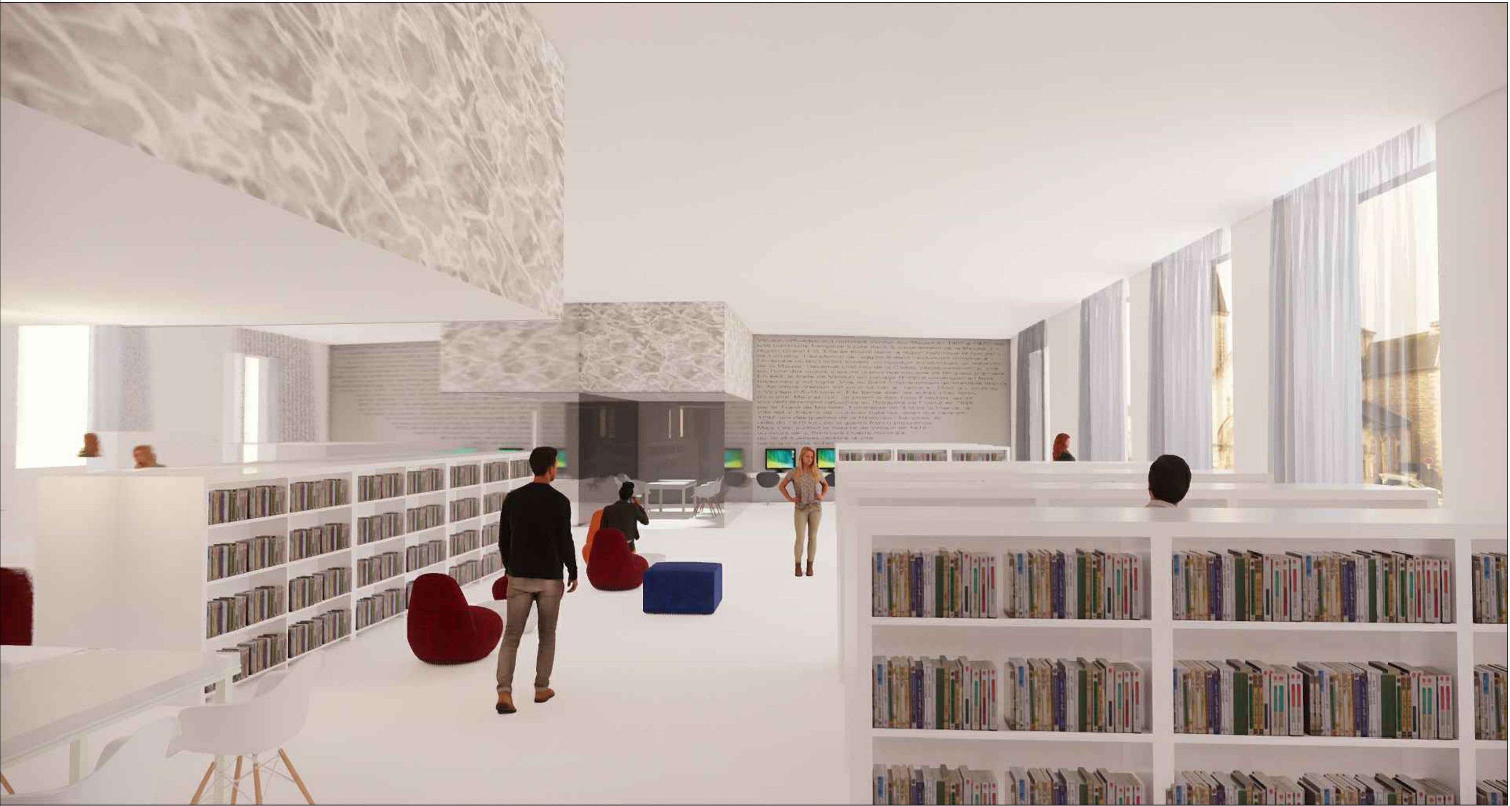
Perspective intérieure espace documentaires-fictions