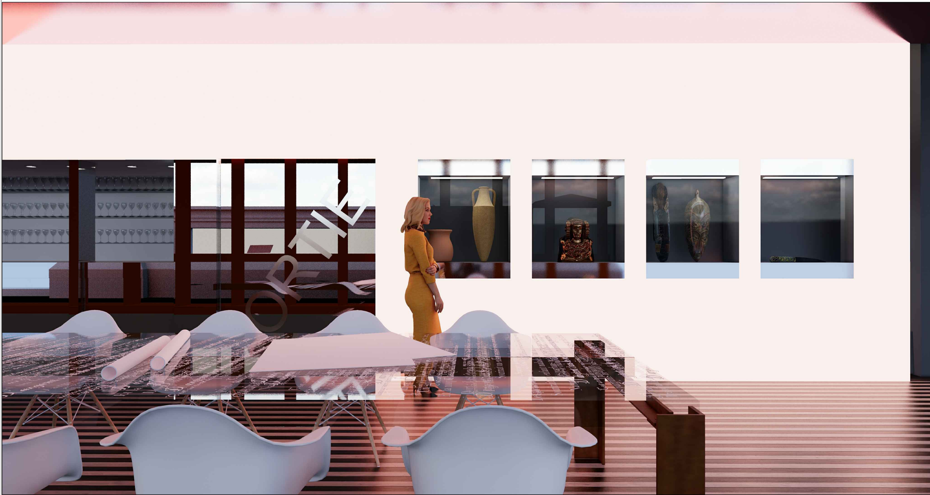
Vue sur les vitrines d'exposition de la lanterne