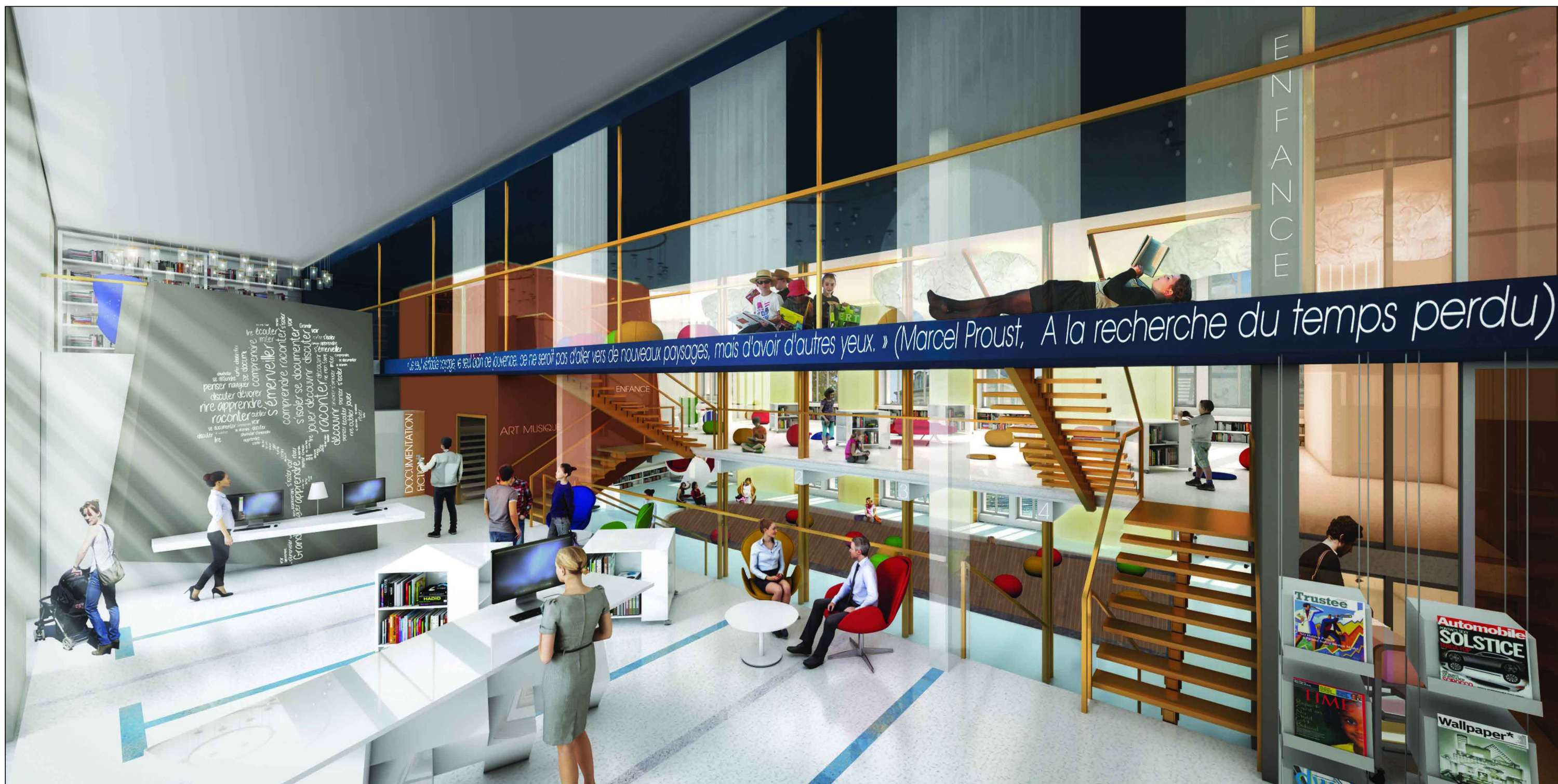
Perspective intérieure du hall