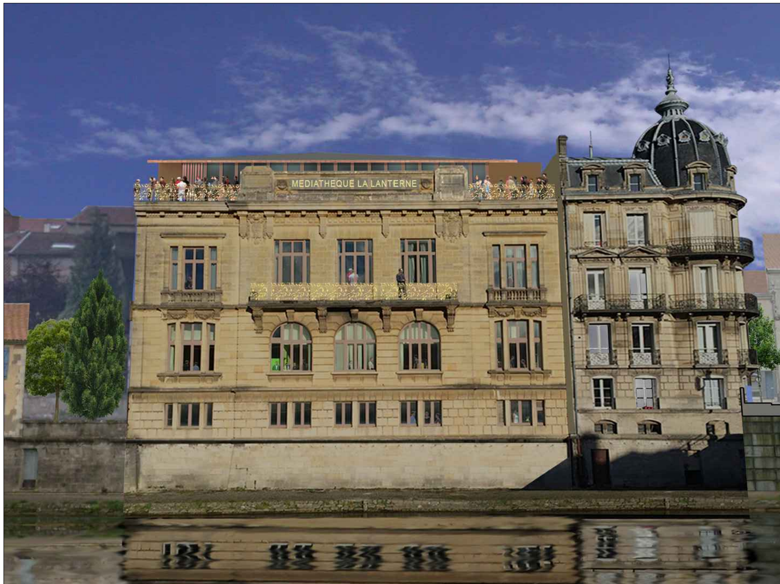
Façade sud vue de jour